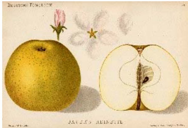
W.Lauche Deutsche Pomologie 1882/83.

ORIGINE : Allemande. Introduite près d'Aix-la-Chapelle. Etudiée en réunion pomologique en Allemagne en 1877.